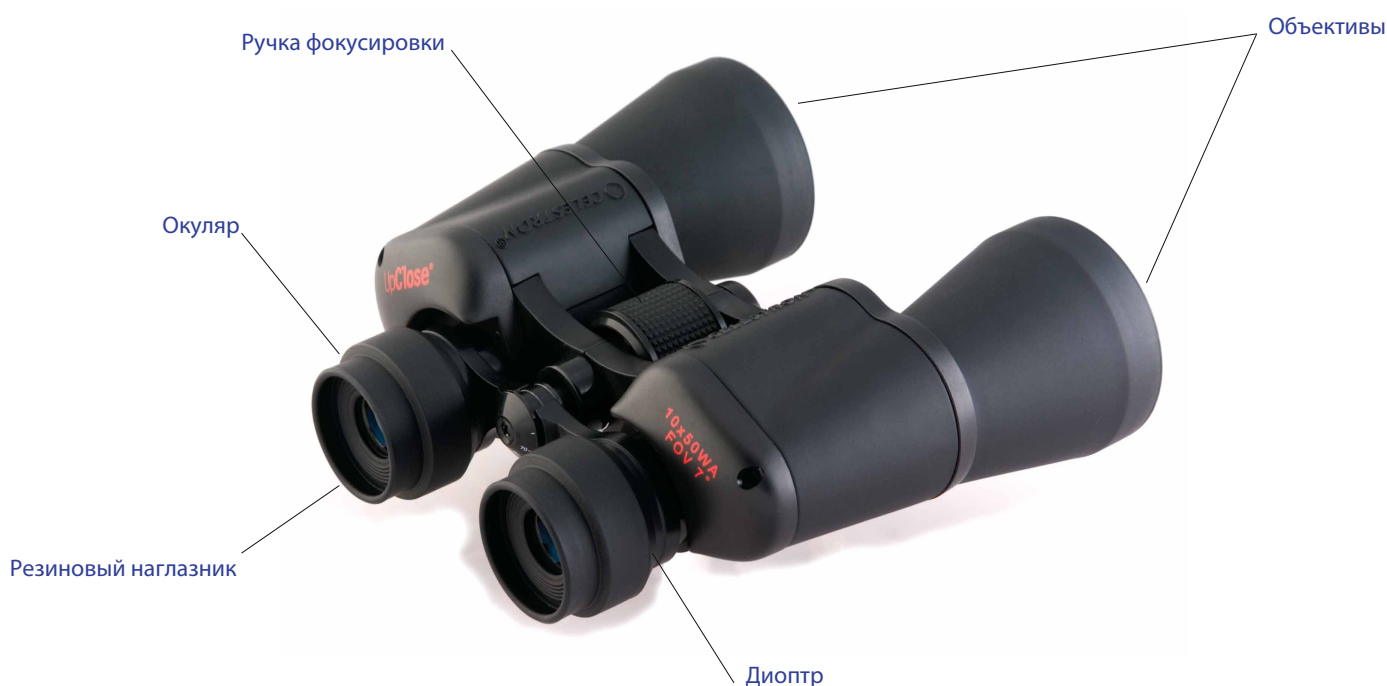
Рис. 1 Составные части бинокля

Мы предлагаем вам ознакомиться с различными моделями, представленными на нашем сайте. Какой бы бинокль вы не выбрали, вы можете быть уверены в высочайшем качестве и ценности покупки.